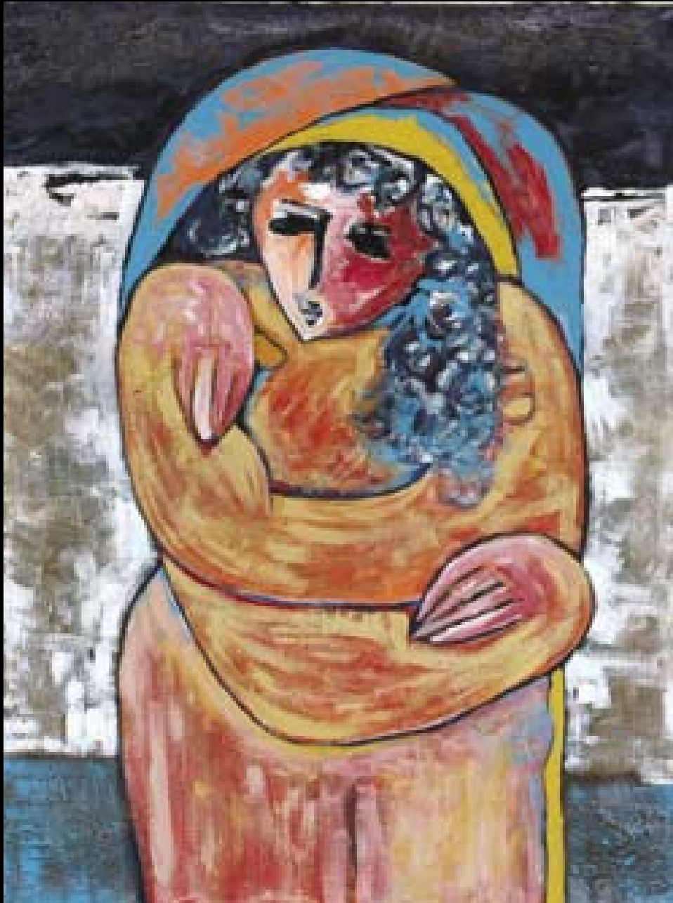
Rima Al Mozaen