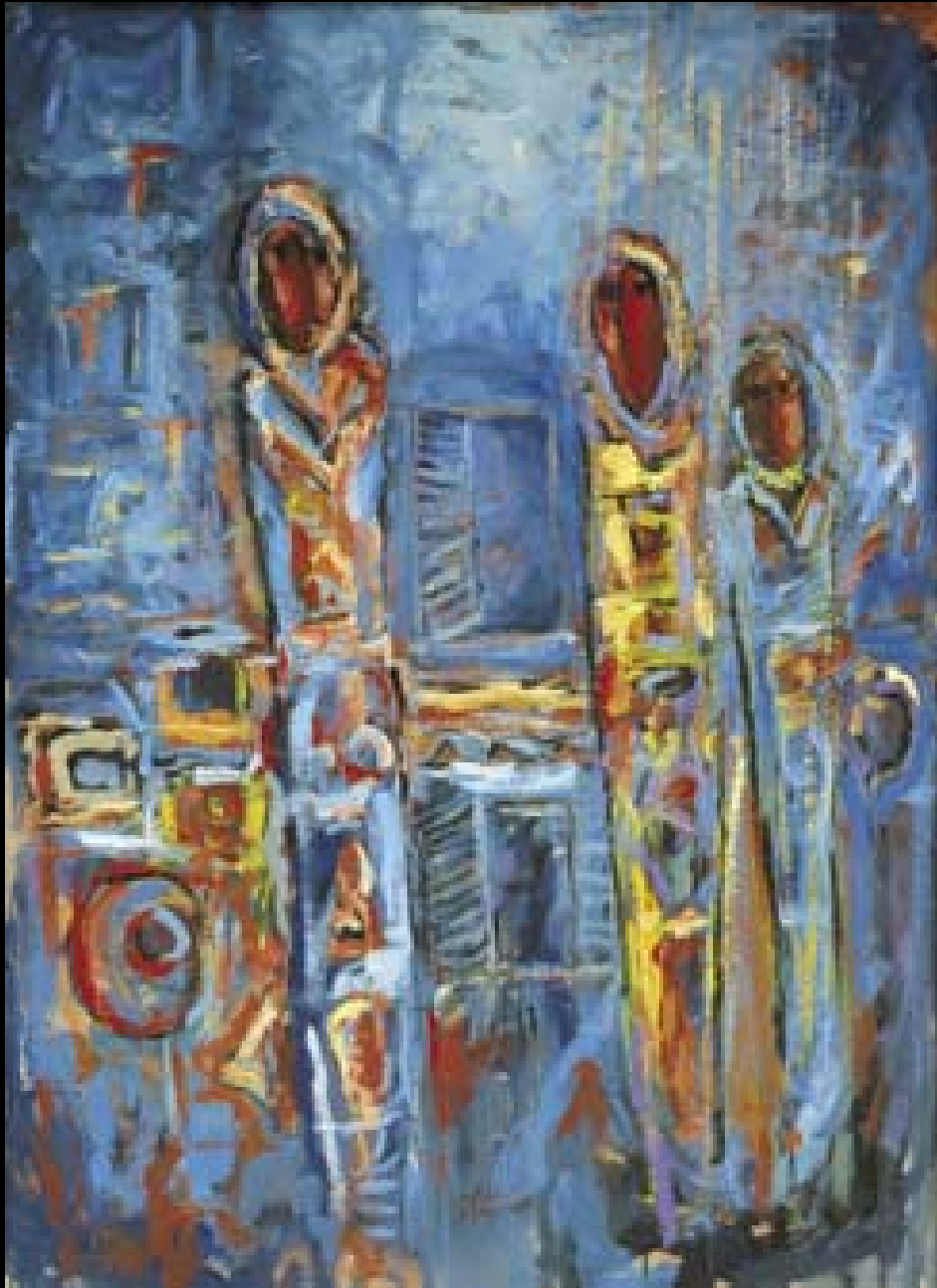
Bashar Al Hroub